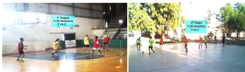
Figura 1: Filmación de la prueba de ingreso sociomotriz.

Protocolo de Filmación: Se utilizaron Computadoras Modelo/Marca BGH Positivo con cámara web integrada reversible 0,3 Mpx. Posición fija de la cámara, ubicada en el vértice entre la línea lateral del campo de juego y la línea de media cancha logrando una imagen completa de medio campo de juego. Altura del piso a la base de la cámara: 1,50 mts.