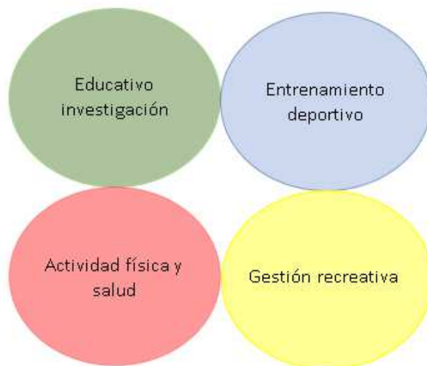
Figura 2. Ámbitos de inserción laboral para el educador físico, según Sánchez y Rebollo (2000).

En otras revisiones, Pinasa (2014) estudió las salidas laborales de 32 universidades españolas, según el informe Vocasport realizado por European Observatoire of Sport and Employment (EOSE) en 2004, la educación física y el deporte se desglosa en varios subsectores laborales debido a la rápida evolución de las prácticas deportivas. Un subsector es el deporte profesional o espectáculo, otro es el deporte competitivo o institucionalizado, también el deporte recreativo que incluye actividades propias del turismo activo, así como también hace referencia al subsector de deporte social o educativo.