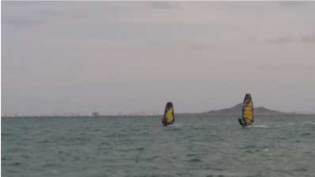
Figura 1. Turismo activo en Murcia

En cuanto a los resultados de sus investigaciones Villalba, et al. (2016), Campos, et al. (2010) y Campos, et al. (2012) coinciden en la tendencia del autoempleo para los profesionales en educación física y deporte, así como en la incursión laboral en el sector privado, esto debido a que los sectores educativo y deportivo ya no son una oportunidad sólida de empleo para los profesionales en actividad física y deporte.