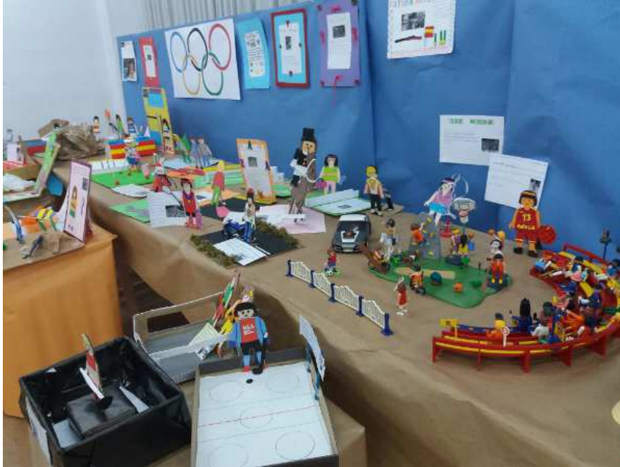
Figura 6: Fotografía de la exposición realizada en el CEIP Antonio Machado.

Agradecer a la comunidad educativa del CEIP Antonio Machado de Lucena (Córdoba, España) su implicación y participación en el trabajo de Visibilización de las mujeres en una sociedad en continuo cambio.