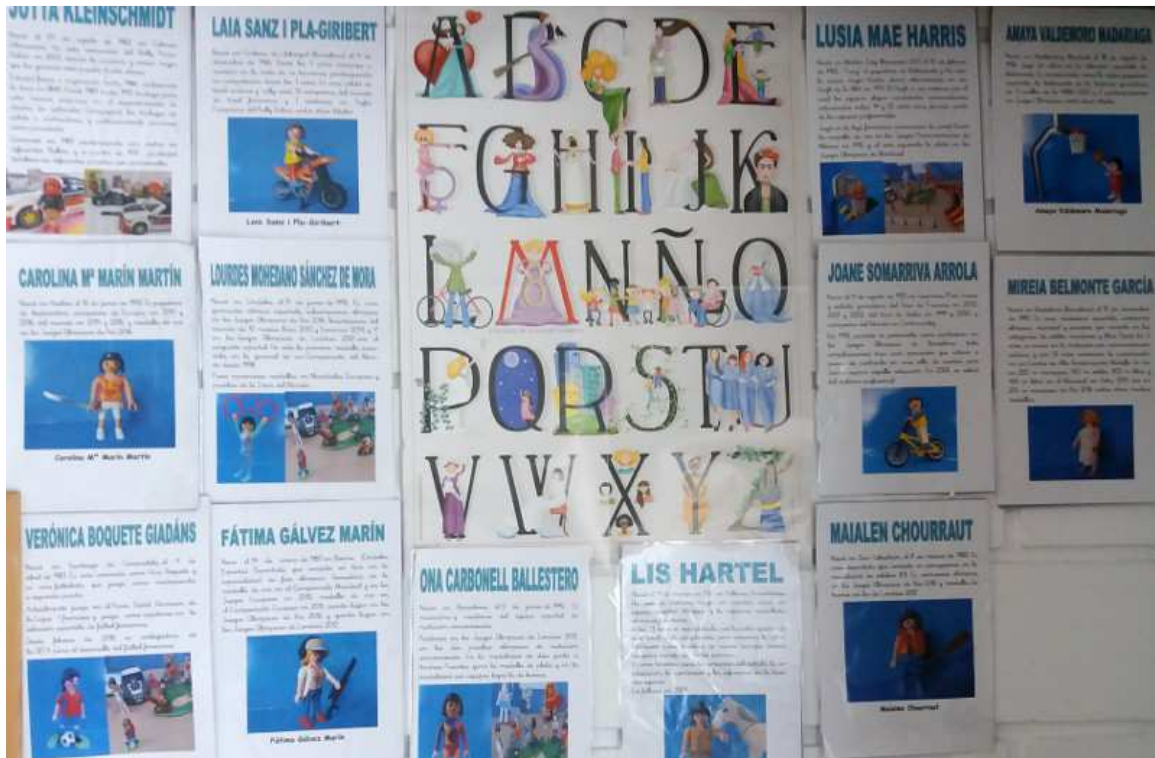
Figura 4: Algunos de los carteles realizados para la visibilización de mujeres deportistas.

fomentando la visibilización de las mujeres, dentro y fuera del centro escolar: habiéndose realizado exposición de carteles en los patios del recreo del CEIP Antonio Machado de Lucena (Córdoba); en las Ferias del Emprendimiento realizadas en Córdoba; en las Jornadas de Igualdad realizadas en Lucena (Córdoba), Peñarroya (Córdoba) y Córdoba; o en el Centro Cívico Norte, de Córdoba.