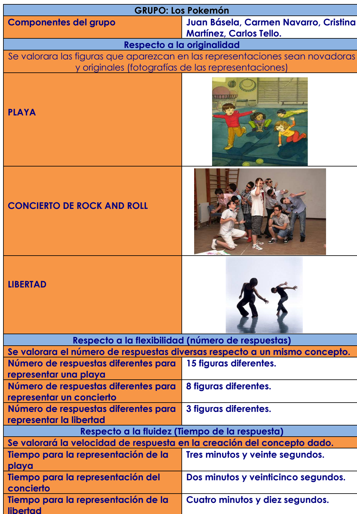
Tabla 2. Ficha de Flashes Pablo Del Pozo Moreno