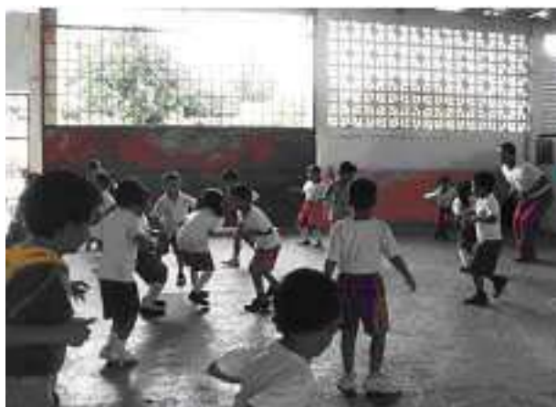
Imagen 1. Ambientes reales para construcción del conocimiento y significados.

Está claro que la finalidad de la educación básica es crear escenarios o ambientes reales del contexto y donde el estudiante construya sus conocimientos y significados, de esta forma adquiera aprendizajes relevantes, es decir lo que aprenda en la escuela debe ser útil para su vida, por consiguiente vivir en plenitud y feliz como lo propone Pérez Gómez (2009).