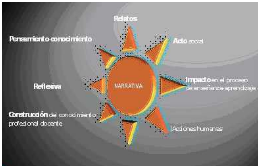
Esquema 2. La Narrativa como vía para alcanzar la reflexión en la práctica docente.

práctica docente (Caporossi, 2009). Y desde luego que ayuda al educador físico en hacer un alto de su práctica, mirarse a sí mismo y darse cuenta de sus acciones para emprender una reconstrucción profesional.