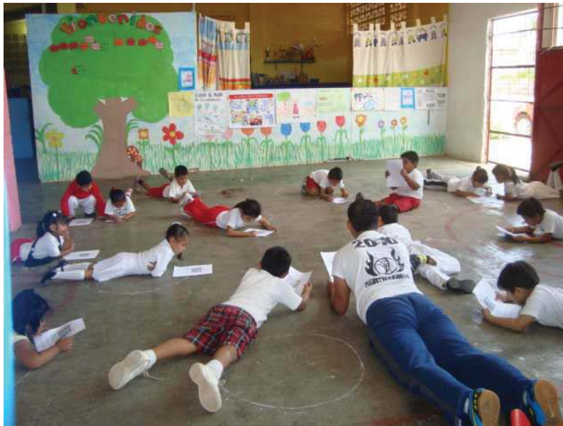
Imagen 3. Alumnos interactuando con el mundo de la información y el conocimiento.

No cabe duda que los docentes debemos ser los primeros en actuar, es decir que desde las acciones que se implementen como formador sean a partir de un cambio de mirada en la escuela, es así que voy a compartir a continuación dos puntos relevantes para alcanzar esta transformación de la práctica docente en la educación física.