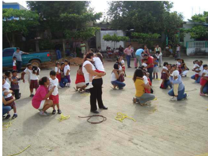
Imagen 2. Practica formativa en desarrollo de competencias.

A todo esto, la educación física como asignatura perteneciente al currículum de la educación básica es parte primordial para alcanzar el desarrollo de las competencias básicas o llave como las designa la DeSeCo 1 . La educación mediante el movimiento corporal intencionado, consciente y reflexivo es parte de una práctica formativa de habilidades, conocimientos, actitudes, fomento de valores y el desarrollo del aspecto emocional. Con lo anterior estamos hablando de una educación física holística, integradora con miras a desarrollar las competencias llave.