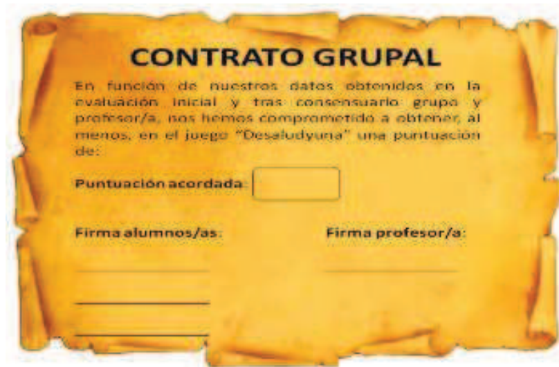
Figura 9. Contrato consensuado para la evaluación grupal

Y por último, las puntuaciones mensuales, es decir, las puntuaciones objetivos según el contrato grupal, se obtendrán multiplicando los resultados mensuales por cuatro.