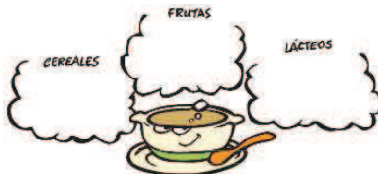
Figura 7. Actividad de aplicación 1 (modificado de AESAN, 2007c)

Escribe o dibuja un desayuno completo que podrías hacer mañana, con alimentos que sabes o crees que hay en tu casa. Marca cada uno con "D" si lo tomarías antes de venir al centro o "MM" si lo tomarías a media mañana.