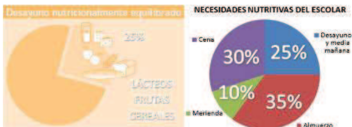
Figura 4. Ritmos alimentarios (adaptado de Carbajal y Pinto, 2006; y AESAN, 2010; respectivamente)

Para que tengamos una idea, la energía consumida a lo largo del día (100%) debe distribuirse en las cinco ingestas diarias, y el porcentaje orientativo necesario de energía para el desayuno de los escolares sería el siguiente: