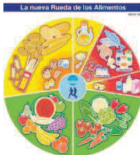
Figura 1. La nueva rueda de los alimentos de SEDCA (2005)

Los grupos de alimentos los mostraremos siguiendo la rueda que exponen Gómez, Loria y Lourenço (2008):