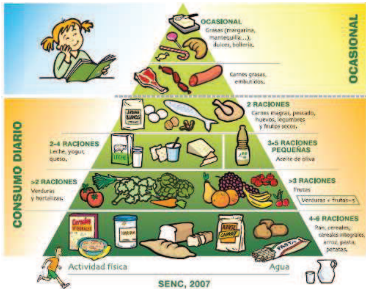
Figura 2. Pirámide de alimentación saludable (extraído de Programa Perseo, 2007b)

La cantidad en la que deben consumirse estos alimentos se expresan en raciones, y para ello diversos autores han tratado de expresarlo de forma gráfica, generalmente en forma de pirámide (aunque existen otros como el Rombo de la Alimentación, figura muy didáctica que podemos encontrar en “La guía visual de los alimentos y raciones”). Exponemos una de las múltiples que nos podemos encontrar: