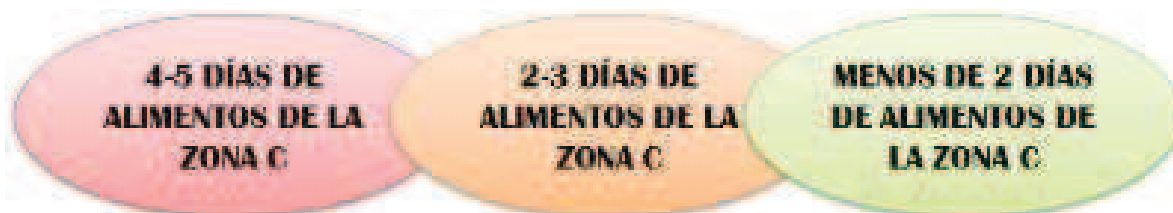
Figura 3. Grupos de nivel (ver figura 6 para comprobar los productos de la ZONA C)

En función de esta evaluación inicial podríamos hacer tres grupos de nivel (estilo de enseñanza), para atender así a la diversidad del alumnado: