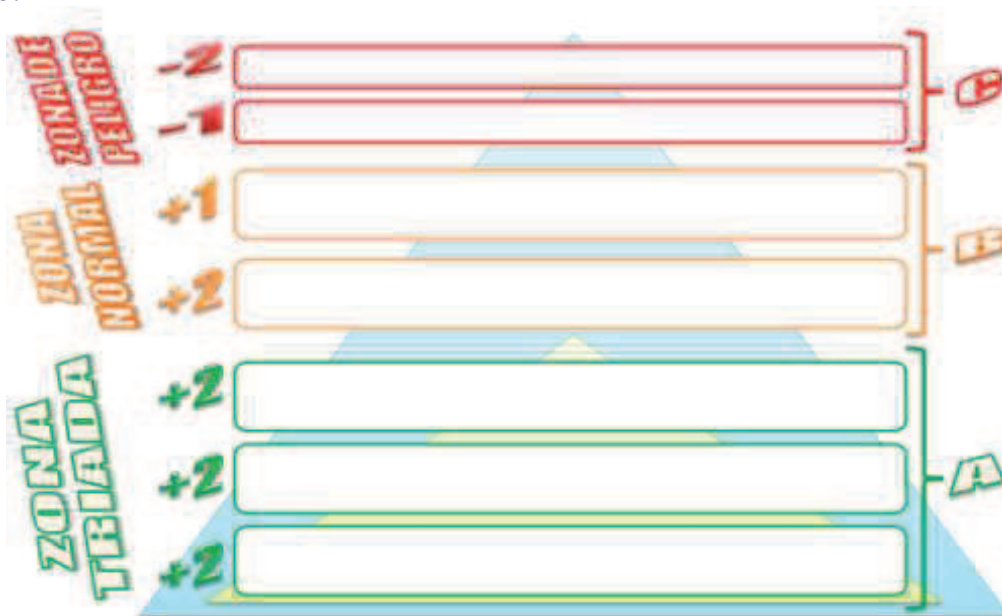
Figura 8. Actividad de aplicación 2

Recorta productos o alimentos de los catálogos que habéis traído de la tienda más cercana a vuestra casa. Una vez recortados tenéis que pegarlos en vuestra pirámide "Desaludyuna". Inconveniente: para llegar a vuestra pirámide tenéis que pasar un pequeño desafío (circuito de habilidades motrices), solo podéis transportar un recortable por persona, además, solo puede estar un miembro del grupo en el circuito.