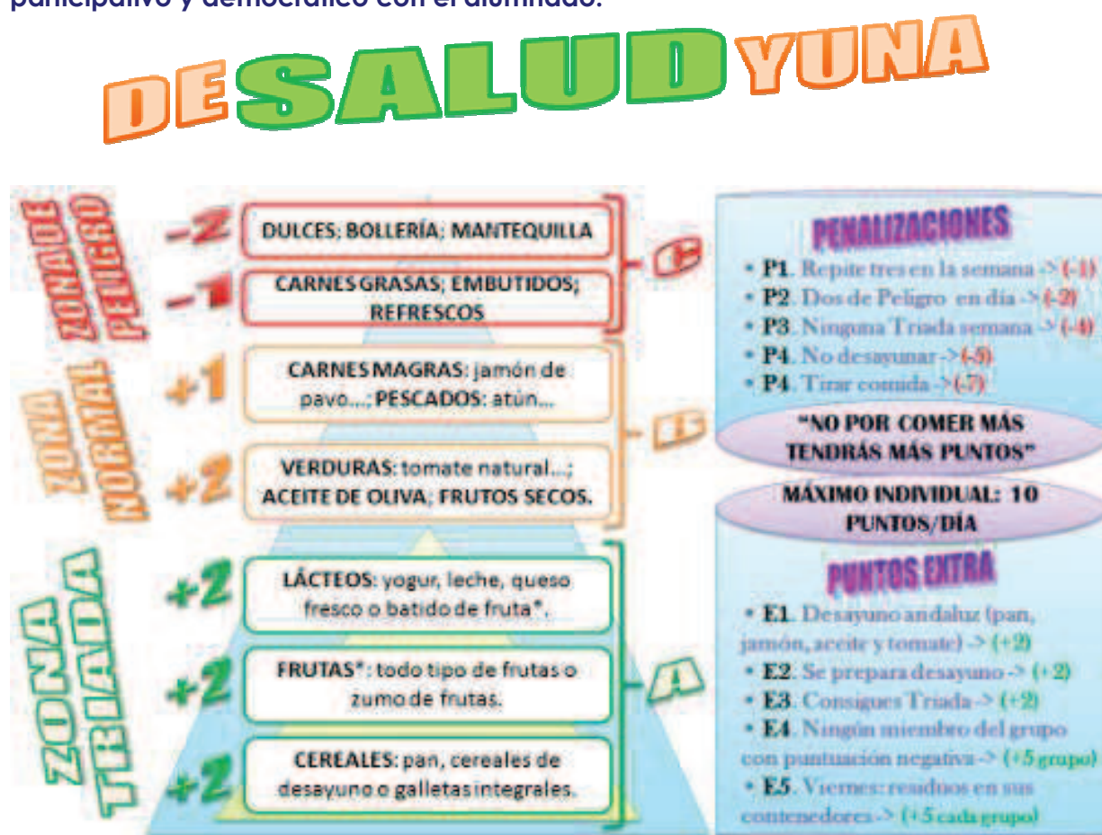
Figura 6. Juego de la pirámide “Desaludyuna”

Utilizar el juego servirá como medio motivador para conseguir los aprendizajes deseados. Debemos de aclarar que la pirámide se construirá democráticamente con el grupo-clase, así como las penalizaciones y puntos extra ( “es más fácil respetar unas normas creadas por ti que impuestas por otro” ), por lo que esta figura supone un ejemplo o producto creado a partir de este trabajo participativo y democrático con el alumnado.