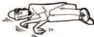
Fase clónica: movimientos y sacudidas bruscas de los miembros