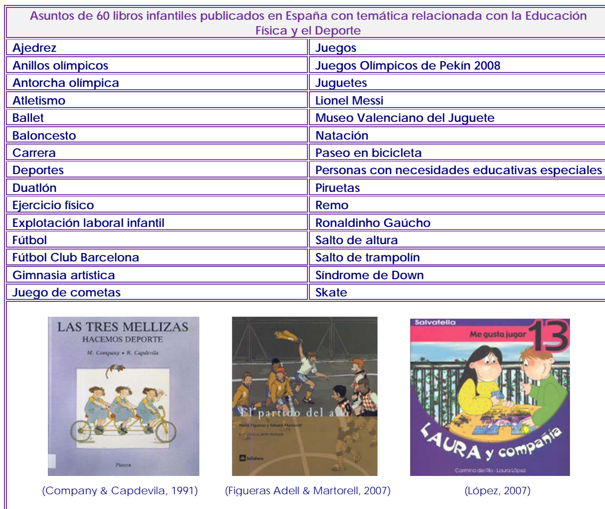
Figura 3. Cuadro con los 30 asuntos identificados en 60 libros infantiles publicados en España con temática relacionada con la Educación Física y el Deporte (Botelho, 2014a).