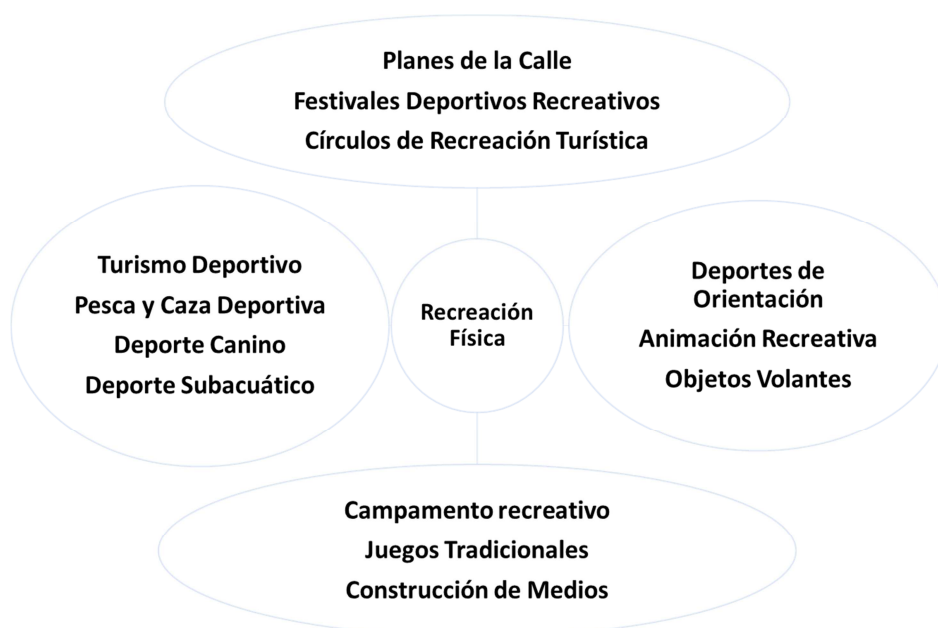
Figura 2. Actividades que forman parte de la Recreación Física. Elaboración propia.

Asimismo, la práctica regular y sistemática de estas actividades, se realizan con la sana intención de mejorar la salud y por ende la calidad de vida de los seres humanos. Es coincidente la apreciación de las fuentes consultadas al señalar que la actividad física y la recreación es de gran importancia para la vida del hombre y para fomentar su dimensión humanística (Correa y Henao, 2018).