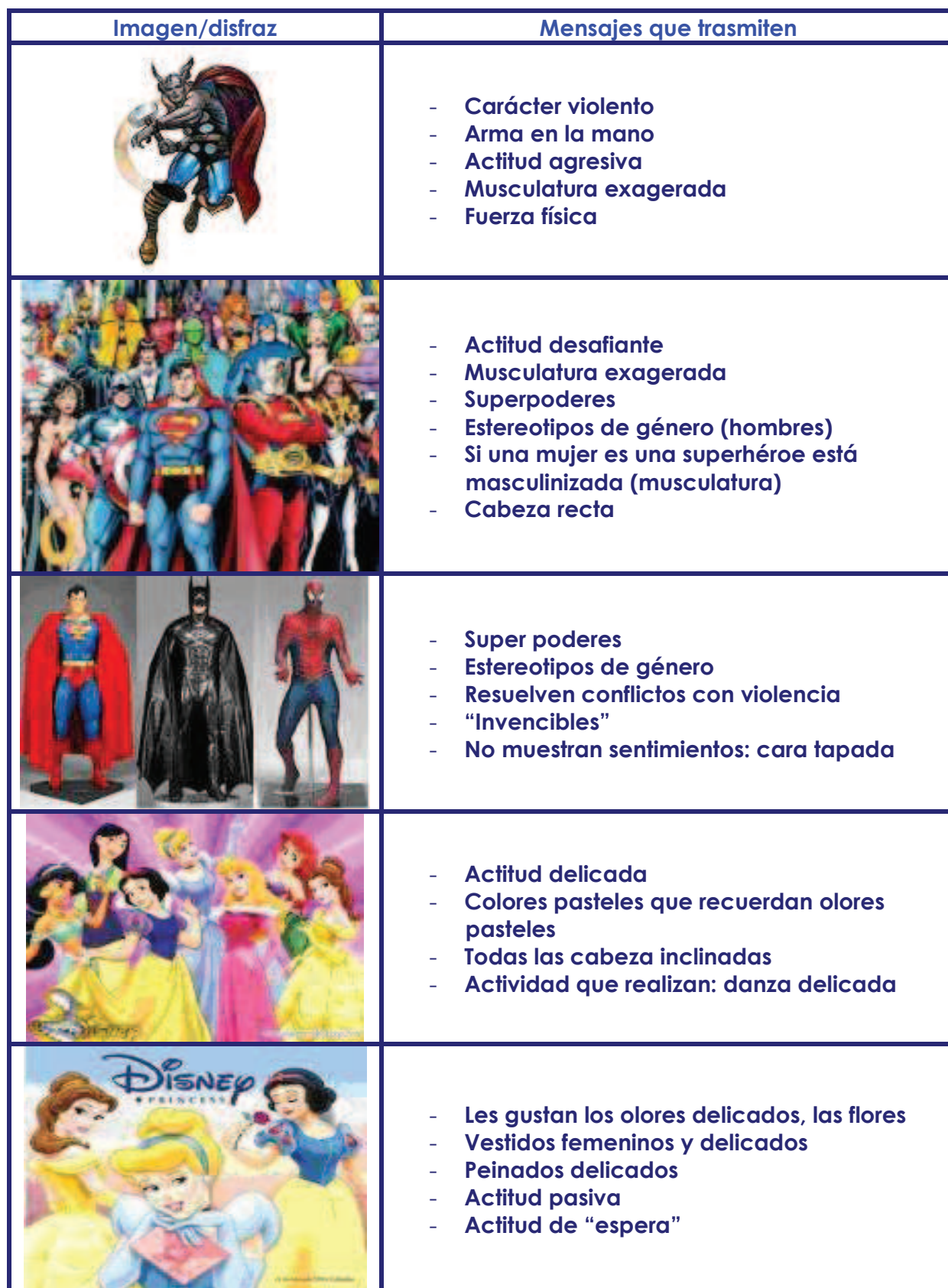
Cuadro 3. Mensajes que transmiten los disfraces

en su lugar contenidos educativos y más idóneos, aprovechando los cuentos y las historietas vistas en clase en cada sesión propuesta por su tutora.